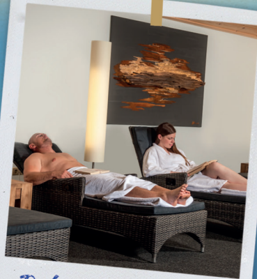
Ruhe- und Lesehaus